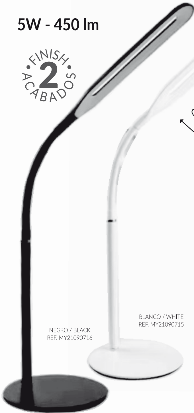
NEGRO / BLACK REF. MY21090716