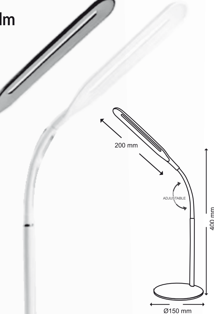
BLANCO / WHITE REF. MY21090715