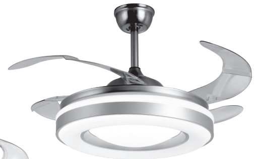
FAN JUPITER SILVER - PLATA REF: B-1001