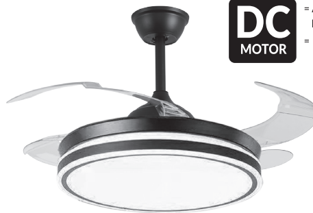
FAN ASGARD BLACK - NEGRO REF: F-1006 WHITE - BLANCO REF: F-1005