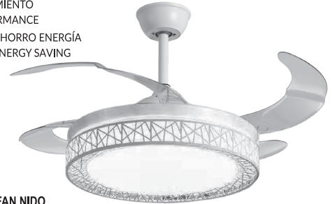
FAN NIDO WHITE - BLANCO REF: F-1007 BLACK - NEGRO REF: F-1008