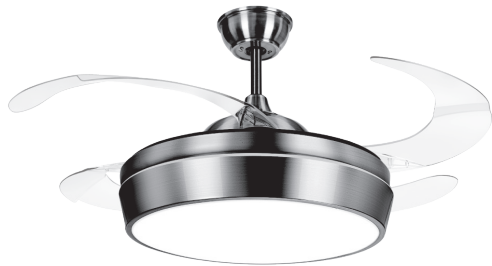
FAN SIMUN WHITE - BLANCO REF: 119591401 CHROME - CROMO REF: 119591401 ANTIC BRASS - CUERO REF: B-119591414 BROWN - RUSTICO REF: B-119591402

MEMORIA DE LUZ - 6 VELOCIDADES - 4 ASPAS RETRACTILES / LIGHT MEMORY - 6 SPEED SETTING - 4 RETRACTABLE BLADES MEMÓRIA LIGEIRA - 6 AJUSTE DE VELOCIDADE - 4 LÂMINAS RETRACTÍVEIS / LICHTSPEICHER - 6 GESCHWINDIGKEITSTUFEN - 4 EINZIEHBARE KLINGEN MEMORIA LUCI - 6 VELOCITÀ REGOLABILE - 4 LAME RETRATTILI / MÉMOIRE D'ÉCLAIRAGE - 6 RÉGLAGES DE VITESSE - 4 LAMES RÉTRACTABLES