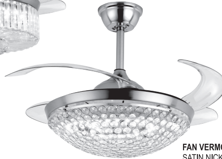
FAN VERMONT SATIN NICKEL/GLASS REF: B-28300SN