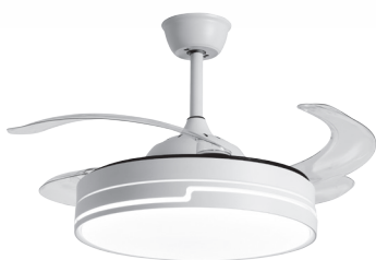
REF: F-1020 FINISH: BLANCO/WHITE