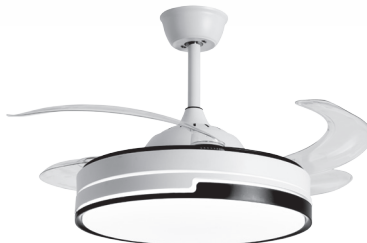
REF: F-1021 FINISH: NEGRO/BLACK