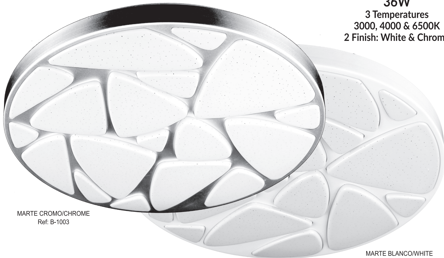
MARTE CROMO/CHROME Ref: B-1003

36W 3 Temperatures 3000, 4000 & 6500K 2 Finish: White & Chrome