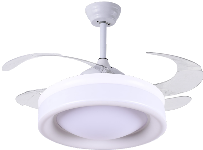
REF. B-1002 | Blanco Branco