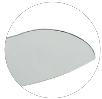
4 Aspas retráctiles 4 Palas retráteis