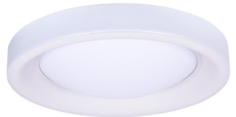
REF.B-1002 PLAF | Blanco Branco