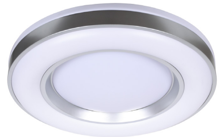
REF. B-1001 PLAF | Cromo Cromado