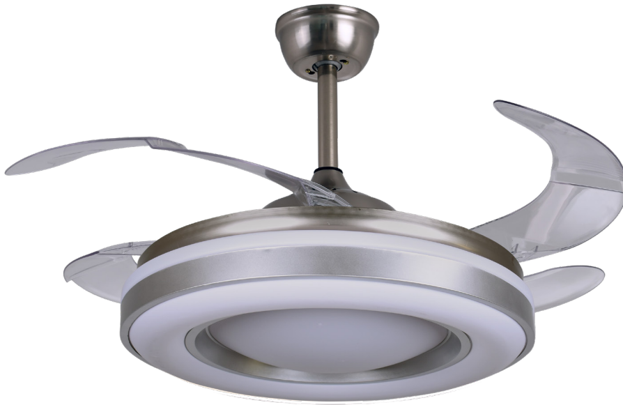
REF. B1001 | Cromo Cromado