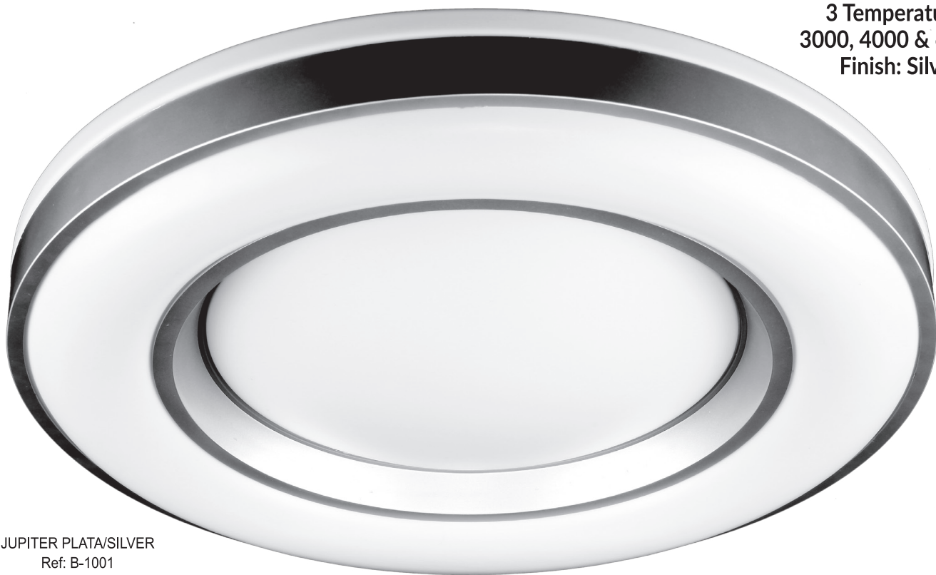
JUPITER PLATA/SILVER Ref: B-1001

36W 3 Temperatures 3000, 4000 & 6500K Finish: Silver