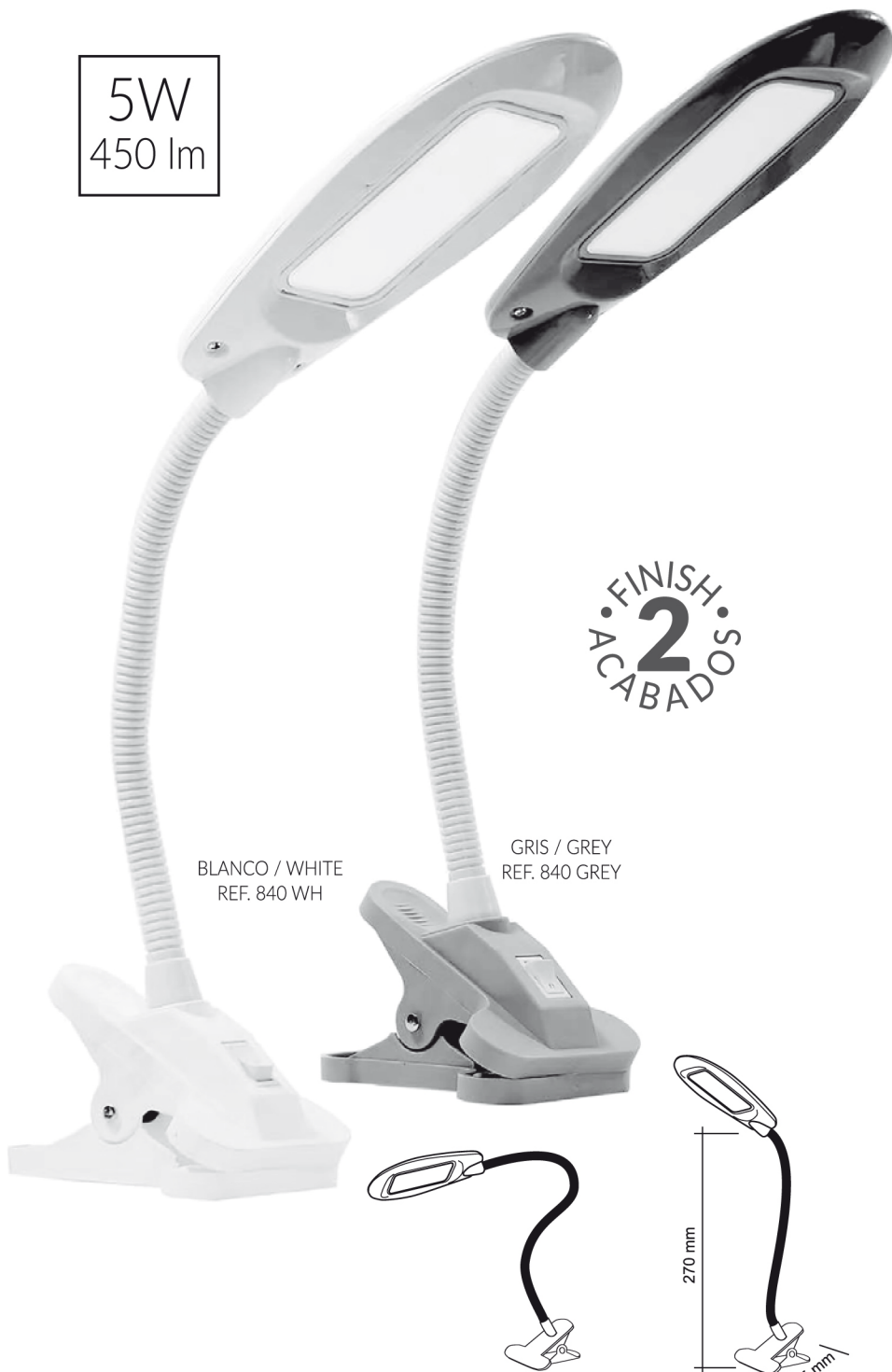
BLANCO / WHITE REF. 840 WH